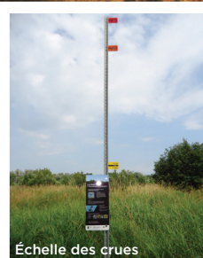
Échelle des crues