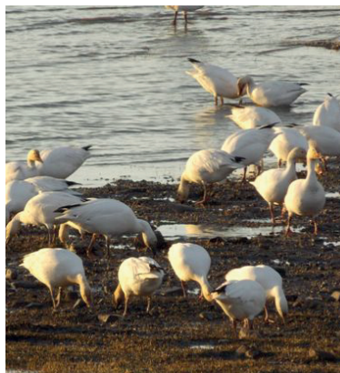
Les grandes oies des neiges

Chaque printemps et chaque automne, les grandes oies des neiges font halte sur l'île le temps de reprendre leur souffle... et leurs forces. Les oiseaux y sont si nombreux que le littoral est désormais reconnu comme une aire de concentration d'oiseaux aquatiques.