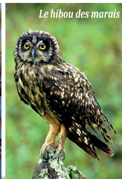
Le hibou des marais

« La Réserve naturelle Jean-Paul-Riopelle abrite un ensemble floristique exclusif à l'estuaire d'eau douce et saumâtre du fleuve Saint-Laurent et qui ne se retrouve nulle part ailleurs au monde. »