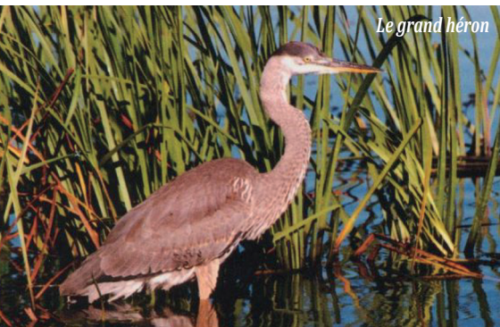
Le grand héron